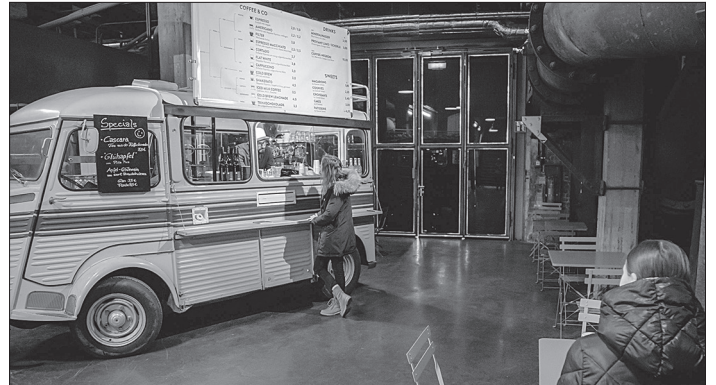
Ausgesuchte Kaffeespezialitäten und Pâtisserie – die Pop-Up-Gastronomie von COMAME im Weltkulturerbe Völklinger Hütte

Der raue Charme der Völklinger Hütte trifft auf ausgesuchte Kaffeespezialitäten und Pâtisserie