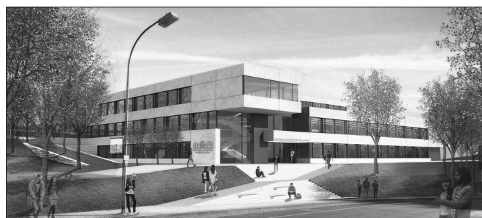
So wird der erste Bauabschnitt nach Fertigstellung Ende 2025 aussehen, Visualisierungen: arus GmbH

Dem Spatenstich voraus ging ein umfassender Planungsprozess. Erste Überlegungen hinsichtlich einer Sanierung mit Teilersatzneubau oder eines kompletten Neubaus gehen bis ins Jahr 2013 zurück. Am Standort werden derzeit 1.547 Schülerinnen und Schüler beschult, davon 986 in Teilzeit. Zur Durchführung des ersten Bauabschnitts werden alle in den noch nicht betroffenen Bauteilen vorhandenen Raumkapazitäten komprimiert genutzt. Durch kleinere Umbaumaßnahmen konnten hierfür zusätzliche Räume gewonnen oder umgenutzt werden.