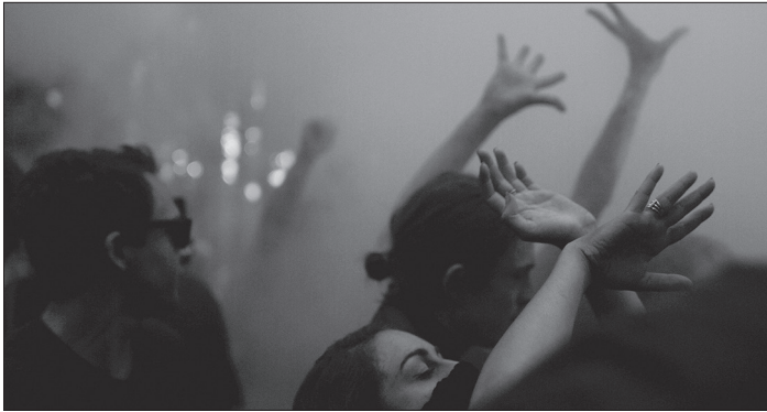
Julian Rosefeldt: PENUMBRA, 2022

EUPHORIA stellt als künstlerische Tour de Force durch die Geschichte des Kapitalismus die Frage, warum dieser bis heute alternativlos zu sein scheint. Drummer geben den Takt vor, ein Chor singt: So wird die bildstark umgesetzte Textcollage aus Zitaten von Adorno, Virginia Despentes und Einstein bis zu Michel Houellebecq und Snoop Dogg zur veritablen Film-Oper. Wir betreten die Empfangshalle einer Bank mit Angestellten im Kapital- und Tanzrausch, fahren mit Giancarlo Esposito im Taxi durch ein explosives New York, stehen mit philosophierenden Obdachlosen in Kiew an der Feuertonne oder mit Lohnarbeiterinnen am Paketlagerband, wir lauschen jungen Skateboarder:innen in einem verlassenen Busdepot und folgen einem animierten Tiger mit der Stimme von Cate Blanchett durch einen menschenleeren Supermarkt.