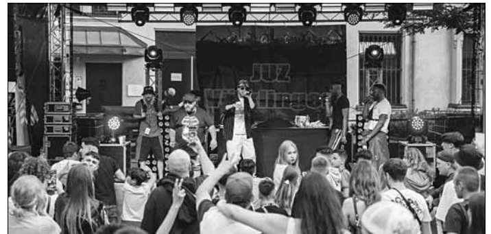
Den Anfang machte das 3x3 Open Air im Pfarrgarten am Freitag

Auch wenn das Bürgerfest den Jahres-Höhepunkt dargestellt hat, so finden noch bis einschließlich Dezember zahlreiche weitere Veranstaltungen im Rahmen des Stadtjubiläums statt. Alle Informationen dazu gibt es auf der Jubiläums-Webseite www.voelklingen-1200.de .