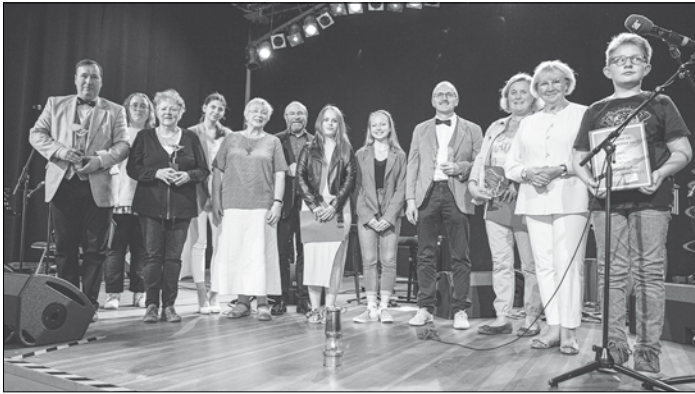
Die Preisträgerinnen und Preisträger des Saarländischen Mundartpreises 2022