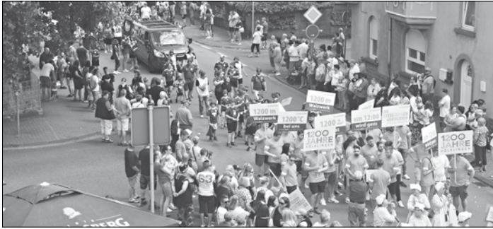
Der Festumzug am Sonntag als Höhepunkt des Bürgerfestes