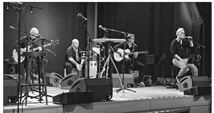
„Die Mizzies“ präsentierten Songs in Mundart