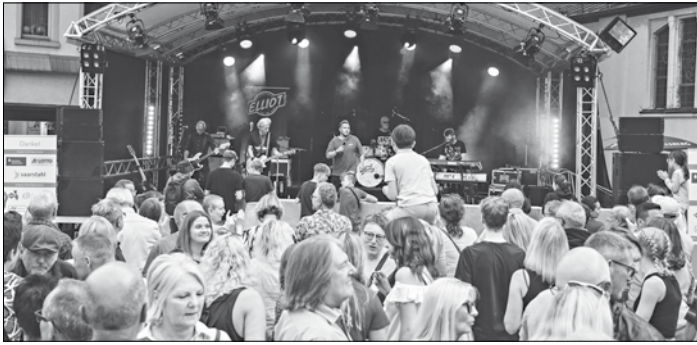
Die saarländische Cover-Band Elliot heizte Freitagabend auf dem Adolph-Kolping-Platz ein