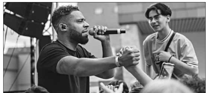
Hauptact am Freitag im Pfarrgarten war der erfolgreiche Deutsch-Rapper Megaloh