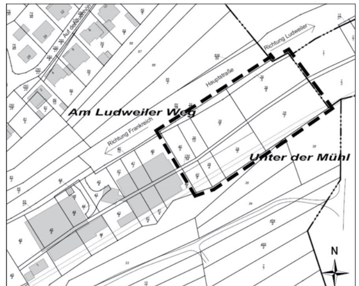
Landesamt für Vermessung, Geoinformation und Landentwicklung, Kontrollnummer: SB 009/05

Der Geltungsbereich des Bebauungsplans umfasst eine ca. 0,6 ha große Fläche. Die Grenzen des Geltungsbereichs des Bebauungsplans sind dem Übersichtsplan zu entnehmen.