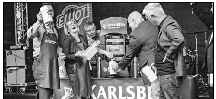
Der offizielle Fassanstich durch Oberbürgermeisterin Christiane Blatt