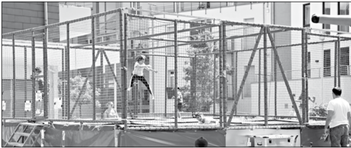
Auch für die Kids gab es ein großes Spiel- und Spaß-Angebot