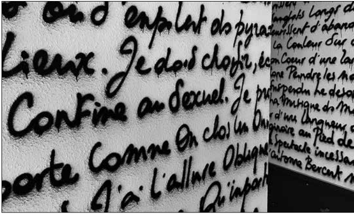
Obsolettrismes: Études en noir, In situ, Stadt Völklingen, Röchling-Bank

tion auf und arbeiten dezidiert politisch. 3. Erstmals führt der Urban Art-Parcours direkt nach Völklingen hinein und erobert programmatisch den Stadtraum jenseits des Weltkulturerbes.