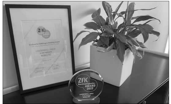
Ganzheitlich und nachhaltig – mit dem Konzept „Volle Ladung: Nachhaltige Mobilität für alle“ holen die Stadtwerke Völklingen Gold beim ZfK-Award 2022 und bringen die E-Mobilität ins Saarland.