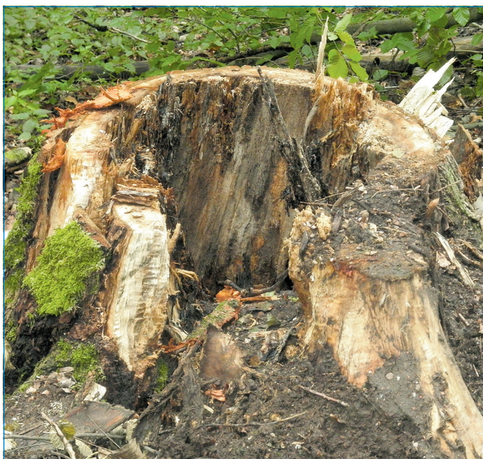
Fäulnisbefall beeinträchtigt die Stabilität eines Baumes, der dann aus Sicherheitsgründen gefällt werden muss.

Geht man zur Zeit im Völklinger Stadtwald spazieren, kann man immer wieder Motorsägen- und Maschinengeräusche vernehmen. Dabei kann es passieren, dass man auf einige quer über den Waldweg gespannte Transparente stößt, die den Waldbesucher darauf hinweisen, dass dieser Weg aufgrund von Waldpflegemaßnahmen momentan nicht betreten werden darf. Der Fachdienst 44, Forstwirtschaft der Stadt Völklingen, führt bis August Verkehrsicherungsmaßnahmen entlang von Rad- und Hauptwanderwegen im Stadtwald sowie entlang von Waldrändern, die an Wohngebiete und an öffentliche Straßen grenzen, durch. Diese Maßnahmen dienen ausschließlich der Wiederherstellung der Sicherheit der Bevölkerung.