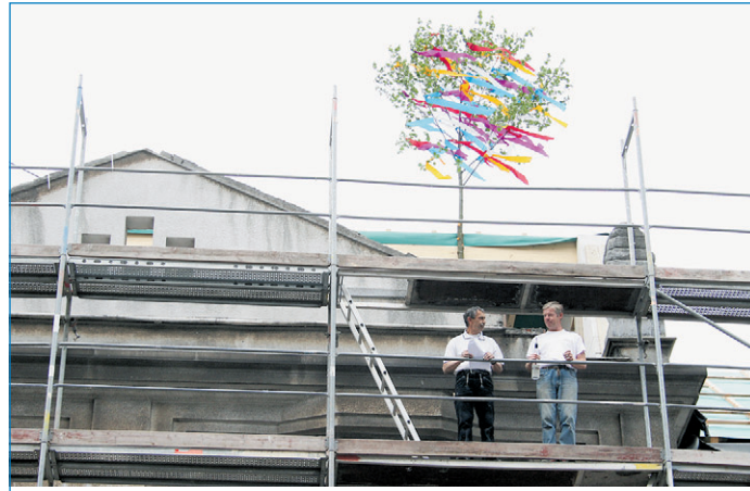
Der Richtstrauß des letzten Jugendstilhauses ist gesetzt

Die Jugendstilhäuser in der Rathausstraße Nr. 24 bis 30 gehören zu den wichtigen Bausteinen der Völklinger Stadtentwicklung. Mit der Sanierung des vierten und letzten Jugendstilhauses kann dieses Gesamtvorhaben abgeschlossen werden. Jetzt wurde Richtfest gefeiert. Ende August des vergangenen Jahres wurde die Baugenehmigung zu dem Projekt erteilt. Danach erfolgten umfangreiche Abbruch- und Entkernungsarbeiten, mit denen im Oktober 2009 begonnen wurde. Da der Start der eigentlichen Rohbauarbeiten in den außergewöhnlich harten Winter fiel, kam es zu erheblichen Verzögerungen im Baufortschritt. Um diese Zeitverluste wett zu machen, läuft aktuell bereits der Innenausbau parallel zu den Rohbauarbeiten. „Nach derzeitigem Stand der Planungen gehen wir davon aus, dass wir den vierten Teil dieses Ensembles Mitte August diesen Jahres fertig stellen können“, zeigte sich der Verwaltungschef zuversichtlich. „60 Prozent der Räumlichkeiten stehen bereits unter Vertrag, und im Oktober werden die ersten Mieter einziehen.“ Die Sanierung des Jugendstilensembles wird im Rahmen