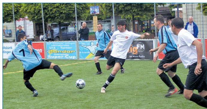
Hobby-, Jugend- und Betriebsmannschaften spielen in der „McDonalds“-Arena auf dem Saarfest 2010

Unter dem Motto „Sommer, Saar und Freizeit“ wird sich in knapp einem Monat das größte Volksfest in Völklingen, das Saarfest, präsentieren: Vom 11. bis 13. Juni verwandelt sich die Schiffsanlegestelle und die Saar-Promenade wieder in eine große Festmeile. Drachenbootrennen, Jet-Boot- und Schiffsrundfahrten, ein buntes Kinder- und Musikprogramm sowie vieles mehr werden für die beste Unterhaltung sorgen. Über 70.000 Besucher werden in diesem Jahr an den Festtagen erwartet. „Ganz Deutschland ist bald wieder im Fußballfieber, und wir wollen dem Thema Fußball auf dem diesjährigen Saarfest eine besondere Plattform geben“, erklärt