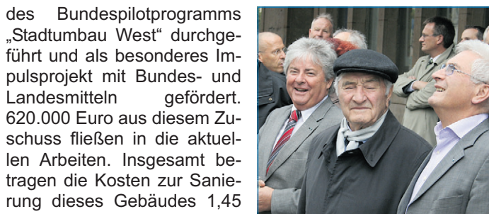
Zufriedener OB mit Blick nach oben

des Bundespilotprogramms „Stadtumbau West“ durchgeführt und als besonderes Impulsprojekt mit Bundes- und Landesmitteln gefördert. 620.000 Euro aus diesem Zuschuss fließen in die aktuellen Arbeiten. Insgesamt betragen die Kosten zur Sanierung dieses Gebäudes 1,45 Millionen Euro. Rund 700 Quadratmeter Nutzfläche werden hier in vier Einheiten wiederhergestellt und zum Teil neu gebaut. Im Sinne der Barrierefreiheit verfügt das neue Treppenhaus, das die Etagen miteinander verbindet, zudem über einen rollstuhlgerechten Fahrstuhl. Geleitet wird das Projekt durch die Stadtent-