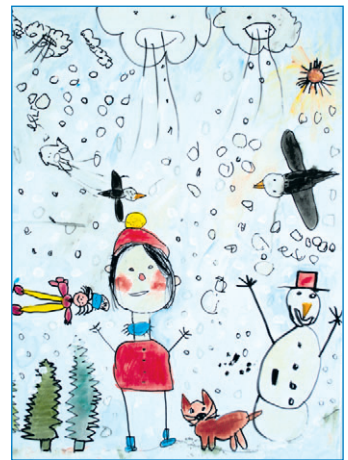
... Herbst und Winter interpretierten die Kinder so: Winter (links), Herbst (rechts)

ten Schützlinge dazu animiert, mit viel Bauchgefühl ihre Fantasie auszuleben. Ich glaube, mehr Begeisterung und Liebe für die Musik kann man nicht ausdrücken, als es unsere jungen Künstlerinnen und Künstler mit ihren tollen Bildern zweifelsohne bewiesen haben.“ Der Bürgermeister dankte in diesem Zusammenhang dem Lions Club und Firma Tautz aus Wehrden, die die Aktion durch ihre finanzielle Spende großzügig unterstützt haben.