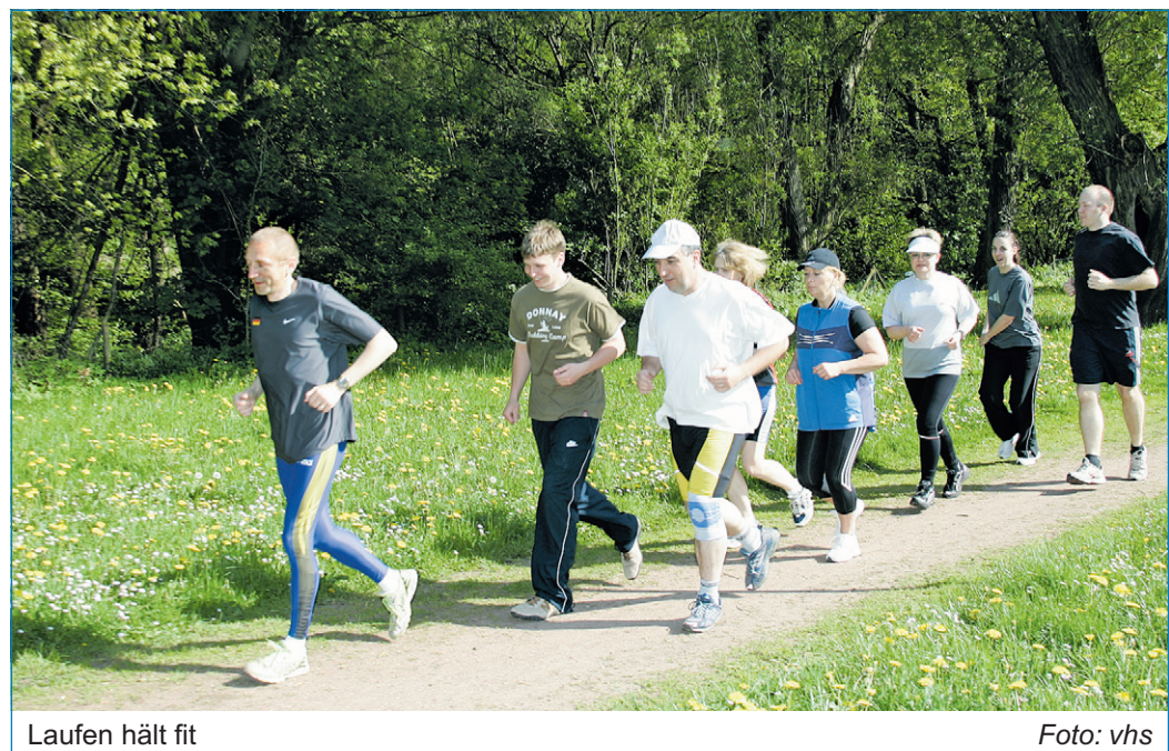
Laufen hält fit