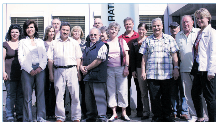
Erfolgreiche Bilanz: Mitglieder des Sicherheitsbeirates vor dem Neuen Rathaus

Sowohl das objektive als auch das subjektive Sicherheitsgefühl der Bürgerinnen und Bürger zu stärken, ist das Ziel des Sicherheitsbeirates der Mittelstadt Völklingen. Mit seinen beiden Arbeitsgruppen, der AG „Sicher leben: Kinder, Jugendliche, junge Erwachsene“ und der AG „Sicher wohnen: Stadtplanung, öffentlicher Raum“ engagiert sich der Beirat dafür, die Sicherheitslage in der Stadt aktiv zu verbessern und Kriminalität abzubauen bzw. durch entsprechende Präventionsmaßnahmen gar nicht erst entstehen zu lassen. Gemeinsam mit der Verwaltung, gesellschaftlichen Institutionen, der Wirtschaft und der Bevölkerung organisieren die über dreißig ehrenamtlichen Mitarbeiterinnen und Mitarbeiter verschiedene Projekte und Veranstaltungen zur Information und Sensibilisierung der Öffentlichkeit. Insbesondere junge Menschen ste-