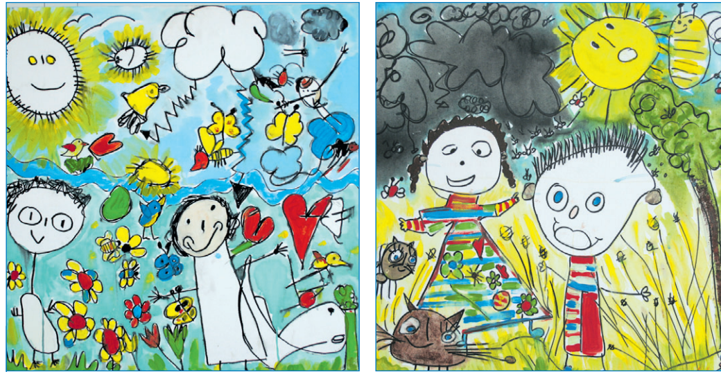
So setzten die Kinder klassische Musik in Bilder um: Frühling (links), Sommer (rechts) ...